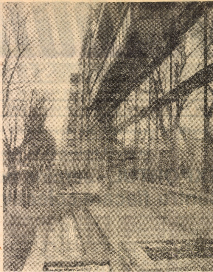
În imagine — blocuri noi, cu partere comerciale, pe Calea Dumbrăvii din Sibiu

Prețul plătit dreptății a fost scump: 11 000 de țărani au pierit năprasnic loviți de gloanțe și obuze, în bătaie ori în temnițe.