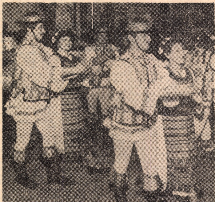
Cu ocazia fiecărei apariții în fața publicului, membrii ansamblului de cîntece și dansuri „Doina Transilvaniei” al sindicatului întreprinderii „Independența” din Sibiu, stîrnesc binemeritate aplauze pentru excelențele momente de autentică artă populară prezentate în fața spectatorilor