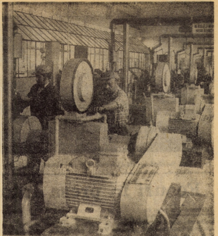
La Centrul de reparații Tirnava, un ajutor prețios pentru buna desfășurare a activității îl constituie cele 6 standuri de rodaj pentru motoare Diesel, echipate cu instalații electronice de urmărire a parametrilor funcționali în sarcină. Acestea au fost amplasate într-o nouă hală, de curînd dată în funcțiune

Pentru evitarea apariției unor boli și respectarea normelor zoo-igienice, o atenție deosebită va fi acordată menținerii curățeniei în adăposturi, realizării vărurilor și dezinfecțiilor. Se va acționa, totodată, pentru menținerea în stare de funcționare a instalațiilor de ventilație și