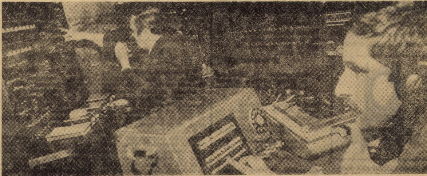
Întotdeauna ceferiștii sînt la datorie veghind la siguranța circulației