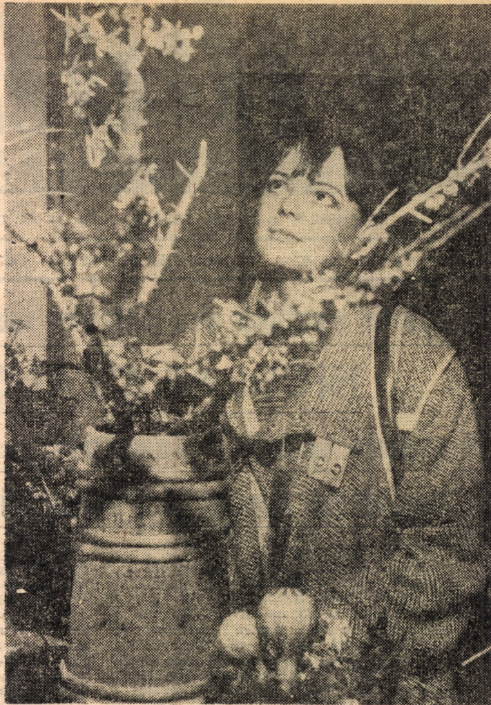
Într-o expoziţie de flori

● Inculpatul s-a urecat pe mesele din local proferînd expresii triviale, după care a început să bată în scaune şi să bea din paharele consumatorilor miraţi, pentru ca în final să se dezbrace pînă la briu şi să danseze spunînd că el e Zorba Grecul. ● Onorată instanţă, faţă de pretenţiile fostului soţ vă aduc la cunoştinţă că oia de care vorbeşte a fost de fapt miel şi l-am consumat de ziua lui, un porc, cinci găini şi strugurii s-au consumat în timpul căsniciei, iar verigeta s-a pierdut în timpul unei certe în familie.