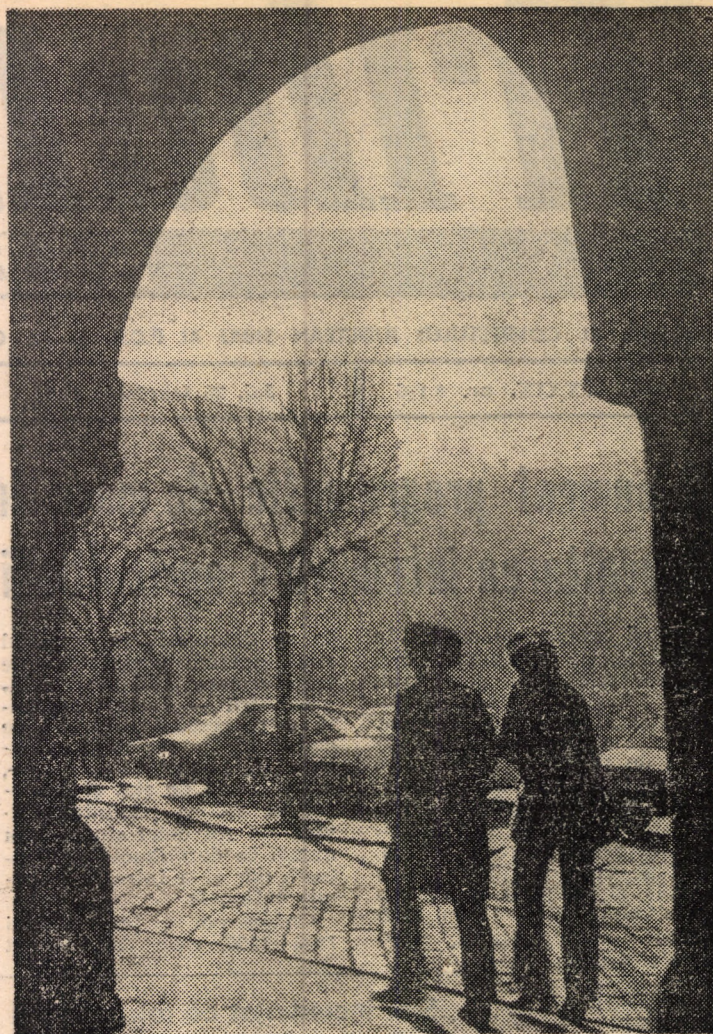
Intr-o dimineață insorită prin centrul Sibiului