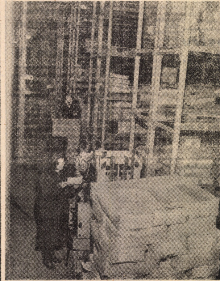
Un aspect de la pregătirea comenzilor pentru unitățile de desfacere la depozitul de mărfuri din Turnișor al I.C.R.T.I. Sibiu