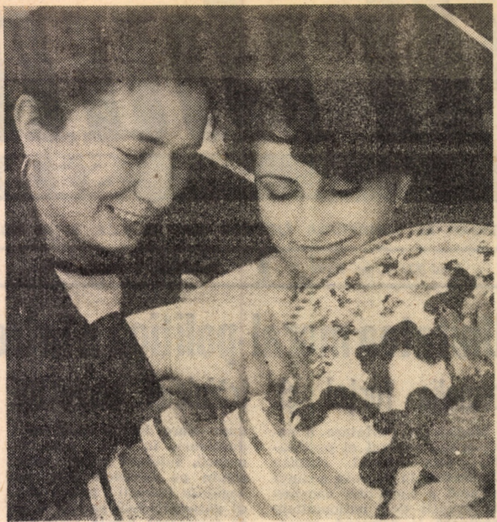
Mărțișoare, mărțișoare...