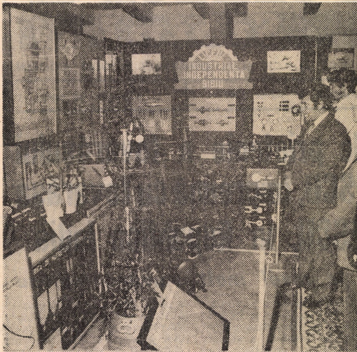
Aspect din expoziția realizărilor elevilor din școli profesionale și licee industriale

S-a avut și se are permanent în vedere problema calificării și perfecționării profesionale a tinerilor, integrarea acestora în cadrul unităților economice. Au fost organizate 28 de cursuri de calificare cu 1 020 de tineri, 315 cursuri de perfecționare, cuprinzînd peste 25 512 cursanți. În marile unități economice au fost organizate 41 de politehnici muncitorești. Pentru perfecționarea pregătirii profesionale a tinerilor au fost organizate și desfășurate concursuri profesionale și olimpiade