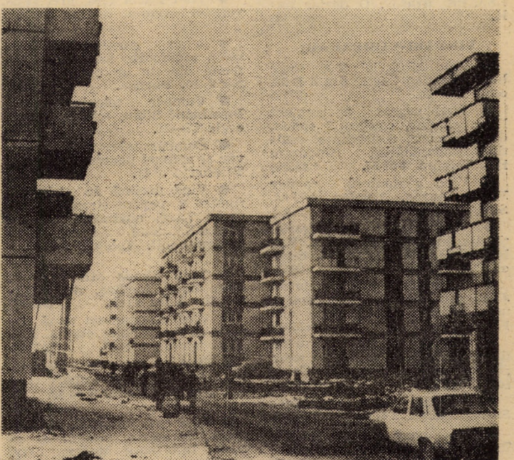
Secvență din cartierul sibian „Valea Aurie”

Dar ascultînd corul școlii — format din elevi din toate clasele — ai parcă imaginea mai exactă a comuniunii de idealuri și fapte ale acestor copii, crescuți demn și frumos sub soarele benefic al socialismului. Aici, indiferent de limba maternă pe care o vorbesc, copiii cîntă și românește și nemțește și ungurește. Ei cîntă patria, partidul și poporul, slăvesc ilustrul conducător al României socialiste, părintele tinerei generații, aduc din inimi tinere imnuri Păcii și cîntă viața fericită și demnă pe pămîntul românesc, convingîndu-se că singura măsură a adevăratului patriotism este fapta.