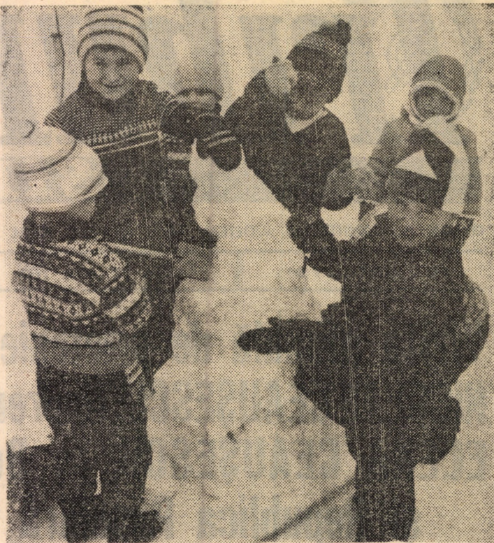
Bucuria copiilor generată de ninsoare se prelungește anul acesta și în... martie