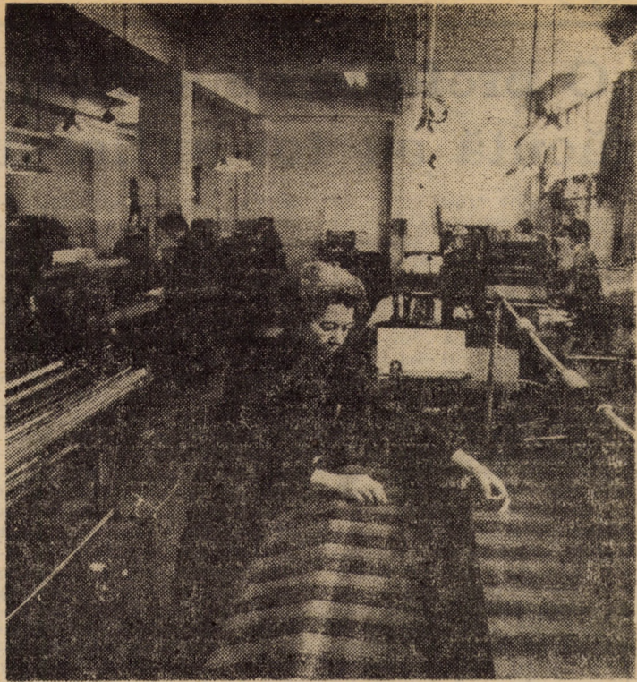
Vă redăm o secvență de muncă din atelierul țesătorie al secției creație de la întreprinderea „Libertatea” Sibiu, unde, pe baza modelelor concepute, se realizează noile țesături de stofe

Președintele Nicolae Ceaușescu și tovarăsa Elena Ceaușescu, împreună cu tovarășul Valentin Ceaușescu, și-au luat un cordial rămas bun de la regele Birendra Bir Bikram Shah Dev și regina Aishwarya Rajya Laxmi Devi Shah.