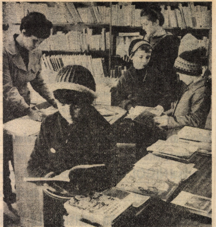
Filiala din cartierul Hipodrom a Bibliotecii „Astra” din Sibiu. Alegerea cărților preferate este mult ușurată prin recomandările făcute de personalul unității.