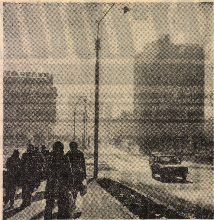
Centrul civic al municipiului Sibiu — o mărturie eloquentă a impetuozității dezvoltării edilitare din ultimii ani