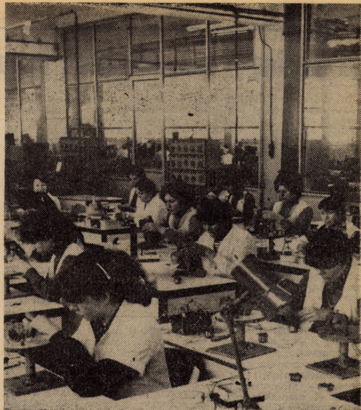
Vă prezentăm un aspect din atelierul montaj al Întreprinderii de relee Mediaș, unde îndemnarea și precizia lucrărilor executate sînt proprii tinerilor care lucrează aici