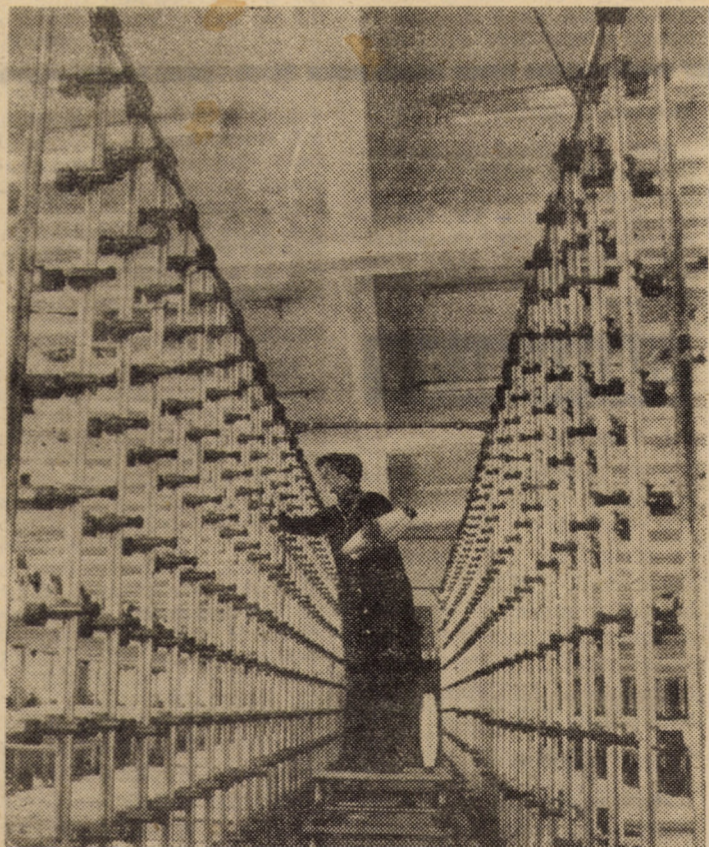
Activitate susținută, de înaltă calitate în sectorul mașini bază-urzi, al întreprinderii „Drapelul roșu” Sibiu