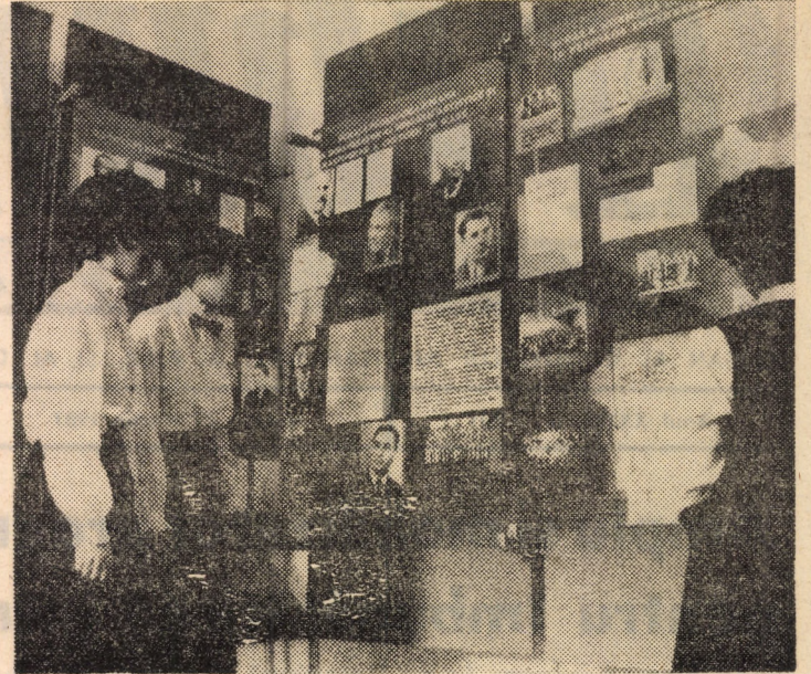
Vă prezentăm o vedere parțială dintr-o microexpoziție din încinta Liceului pedagogic din Sibiu, unde elevii găesc un bogat material documentar-illustrativ