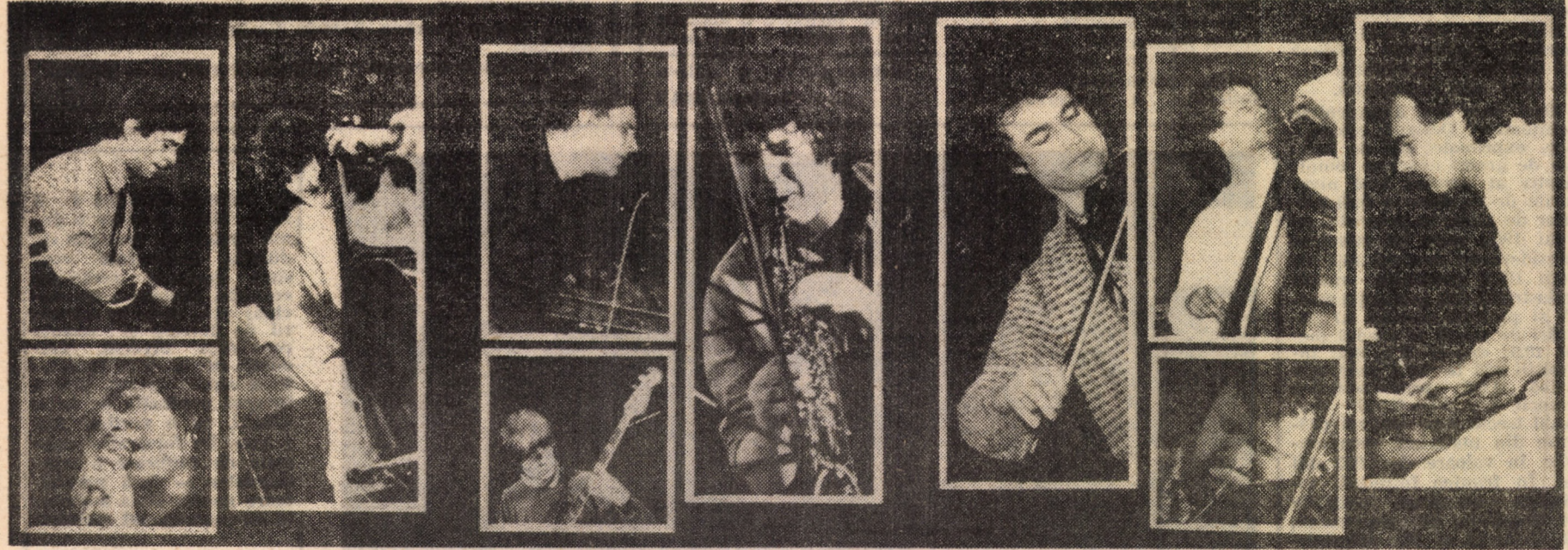
Imagini de la gala inaugurală a Zilelor jazzului sibian '82, care s-a desfășurat sub semnul unui vădit interes, răsplătit de prestații artistice de nivel ridicat.

(cu sprijinul serviciului circulație al Miliției județului)