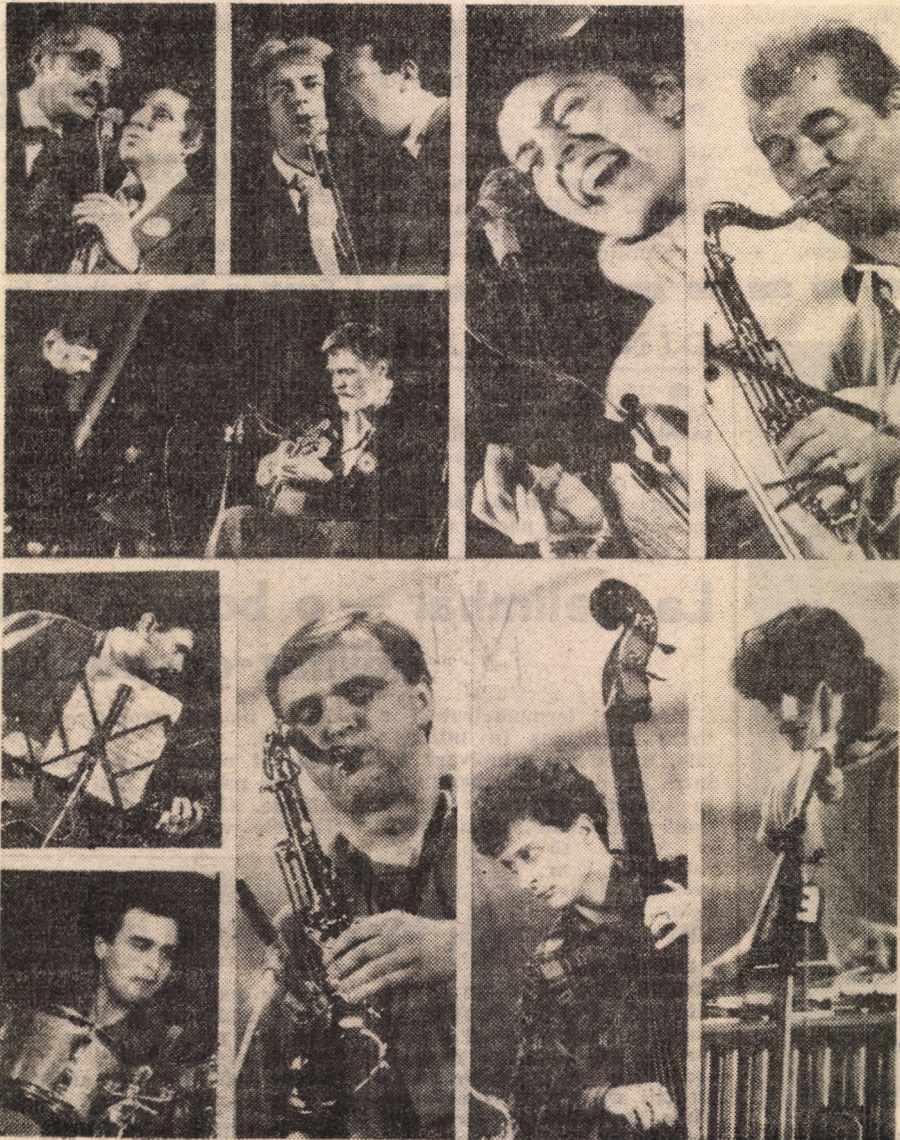
Imagini de la ultimele două gale