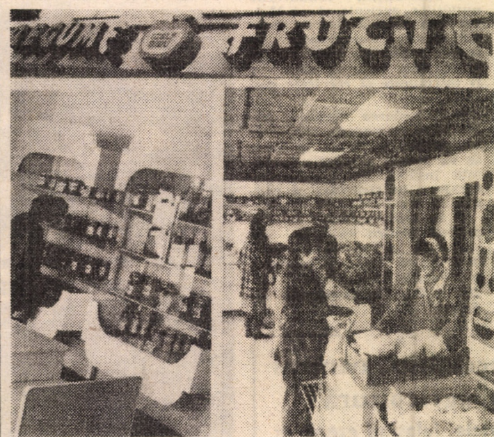
Vă prezentăm imagini din interioarele deosebit de atractive ale unității nr. 36 „Legume și fructe” din cartierul sibian Ștrand, aparținînd de I.C.S.L.F. Sibiu unde, recent, au fost executate ample lucrări de modernizare, mărindu-se totodată spațiile de prezentare și depozitare a mărfurilor. De menționat că, în această unitate, a obținut bune rezultate brigada de „bună servire” formată din tineri vinzătoare