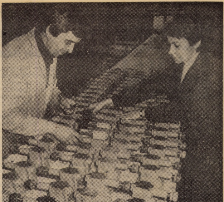
Fabrica de elemente hidropneumatice a întreprinderii „Balanta” Sibiu. Un lot de elemente cu acționare hidraulică supuse controlului interfațic