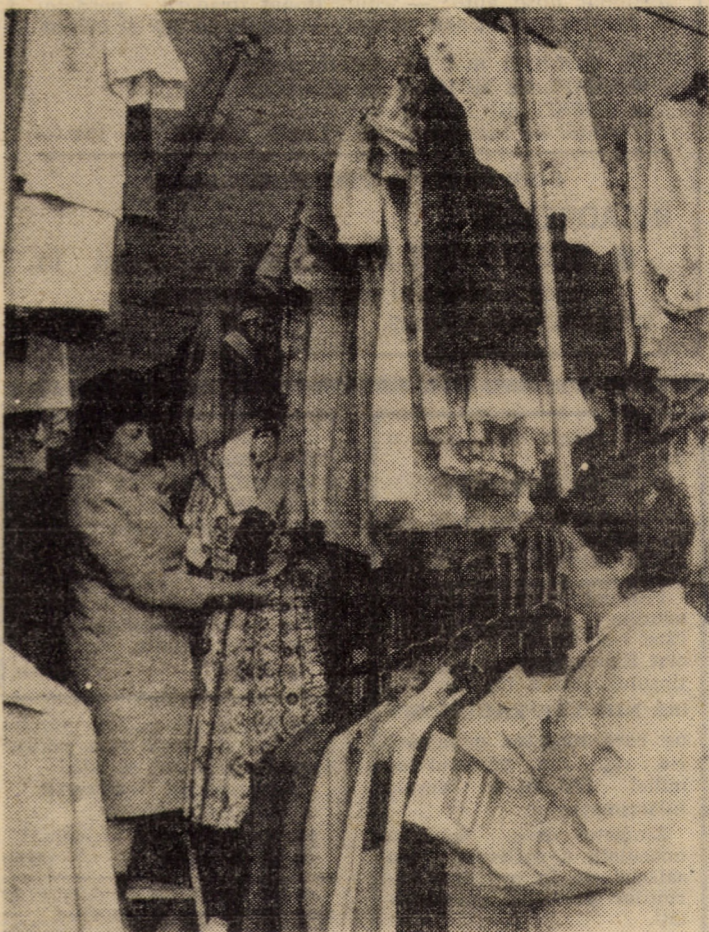
Alcătuirea comenzilor pentru unitățile comerciale, specializate în desfacerea mărfurilor cum sint: confecții, țesături, încălțăminte, articole de mercurerie-galanterie, produse de marochinărie etc., are loc în camerele de prezentare ale I.C.R.T.I. Sibiu, de unde vă redăm o secvență de lucru.