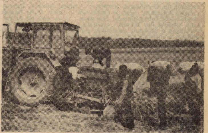
Alimentarea mașinilor de plantat cartofi se poate asemăna cu... o cursă contra cronometru. În cele mai multe unități operația durează mai puțin de 6 minute. Aceasta înseamnă productivitate, ritm înalt la semănat

Întreaga cantitate de sămînță trebuie să ajungă sub brazdă!