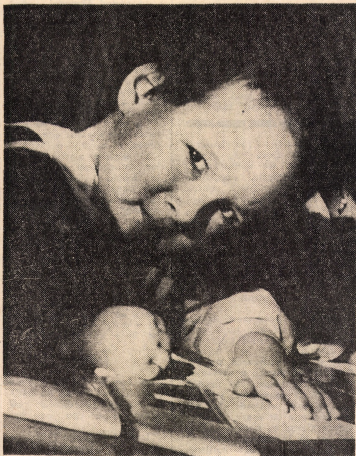
La vîrsta întrebărilor