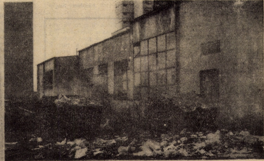
Cartier Hipodrom, Aleea Streiului (lîngă centrala termică 10) — o dresă pentru secția salubritate a E.G.C.L. Sibiu