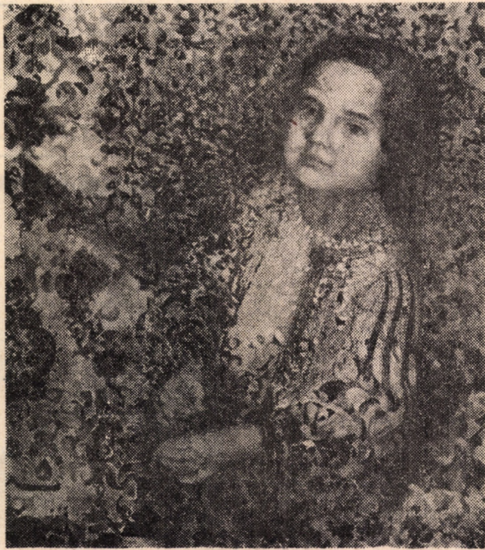
Mona-Genia (detaliu din compoziția „Existența tragică”)