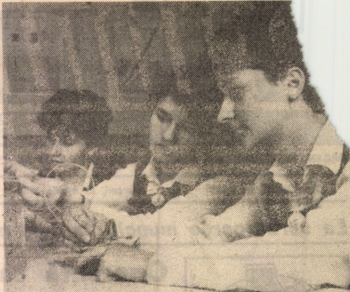
Condițiile oferite arii elevilor din unitățile de învățămînt de toate gradele, reflectă gîndul partidului și a statului nostru de a asigura cadrelor de miine o cit mai bună pregătire profesională.