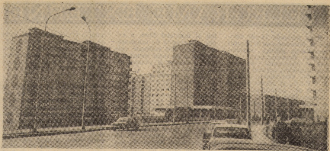
Din arhitectura cartierului sibian „Vasile Aaron” — str. Semaforului

Este momentul să precizăm că, la nivelul conducerii I.J.E.COOP. s-a întocmit un program — aprobat atît de consiliile populare comunale, cît și de organele sanitare — în care s-au nominalizat obiectivele ce trebuie executate în C.P.A.D.M., cu termene și responsabilități precise, o atenție deosebită acordîndu-se problemelor vizînd igiena unităților, întreținerea și modernizarea spațiilor comerciale, îmbunătățirea aprovizionării și prezentării corespunzătoare a fondului de marfă. În plus, în perioada 7—10 aprilie a.c., la Avrig, Agnita și, respectiv, Mediaș au avut loc ședințe de instruire la care au participat președinți ai C.P.A.D.M., gestionari, vînzători etc., dezbătîndu-se o largă gamă de probleme menite să contribuie la pregătirea cît mai eficien-