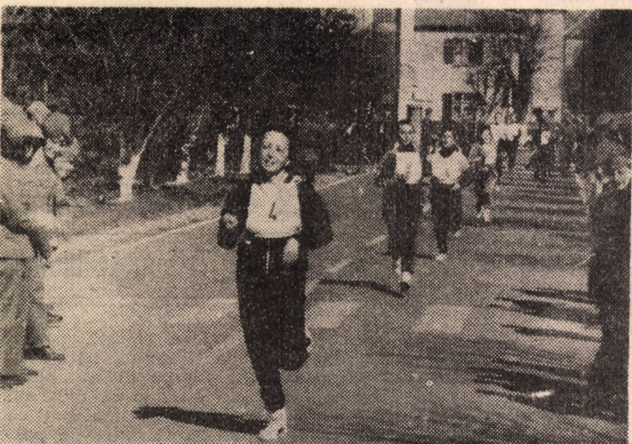
Aspect de la întrecerile de atletism

Intr-o atmosferă sărbătorească, a avut loc duminică, 19 IV, în școlile militare de ofițeri activi „Nicolae Bălcescu”, „Ion Vodă”, și de Transmisuni, în Școala militară de mașini și subofițeri „Gheorghe Lazăr”, în celelalte formațiuni aparținînd Ministerului Apărării Naționale, festivitatea deschiderii etapei de vară a competiției sportive naționale „Daciada”. La această manifestare, au luat parte reprezentanți din cadrul Ministerului Apărării Naționale, comandanți, acti-