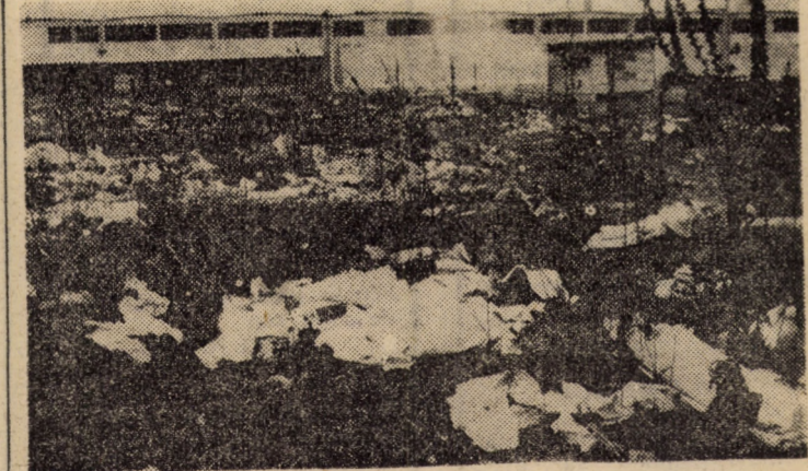
În curtea Depozitului I.C.R.T.I. — Turnișor