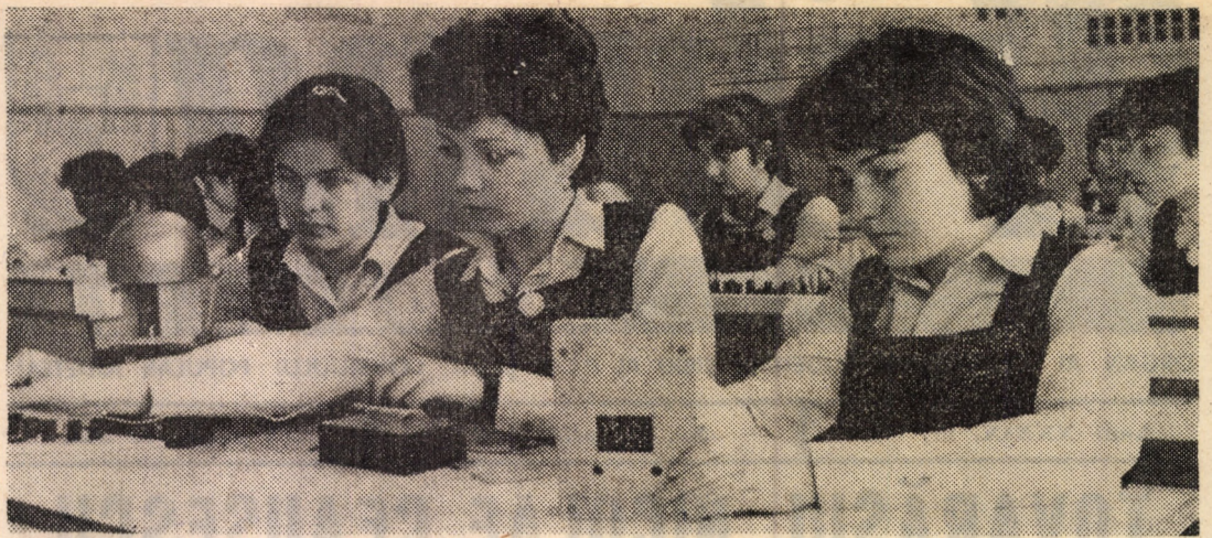
Un moment important în viața elevilor îl reprezintă și completarea cunoștințelor teoretice prin lucrări practice, efectuate în laboratorul de fizică al Liceului pedagogic din Sibiu