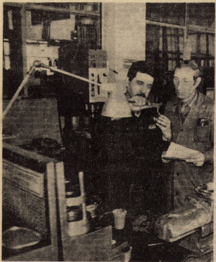
Asimilarea și executarea unor S.D.V.-uri cu grad înalt de complexitate, necesare procesului de producție de la F.P.U.P.S. Sibiu, impune o foarte bună pregătire profesională a colectivului oamenilor muncii din secția scularie, condiție care asigură — în final — realizarea unor produse de prestigiu