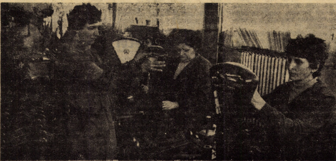
Întreprinderea „Balanța” Sibiu. Vă prezentăm — în imagine — una din benzile de montaj pentru balanțele semiautomate, destinate comerțului, produse care se înscriu în rindul aparatelor de cântărit la care o serie de componente din metal au fost înlocuite cu altele din masă plastică, realizându-se astfel importante economii de materiale