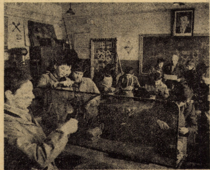
În cadrul atelierului electro-mecanic al Școlii generale nr. 20 din Sibiu, elevii clasei a VII-a B, sub îndrumarea instructorului Eugen Jipa, au contribuit prin lucrări de lăcătușărie la dotarea unității cu diferite obiecte de uz gospodăresc.