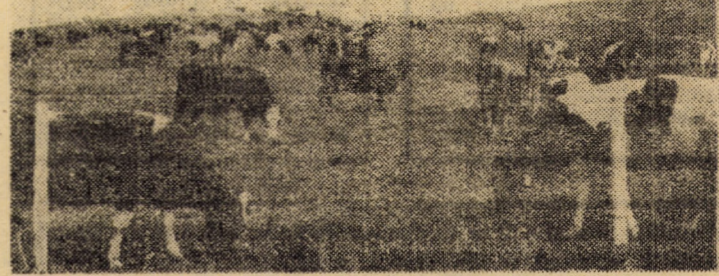
Tabăra de vară din Dealul Marpodului a I.A.S. Noerich — un exemplu de bună organizare și gospodărire.

Se asigură bine transportul, prin intermediul curselor rapide, oamenilor muncii la și de la locul de muncă, I.J.T.-L.S. făcînd în acest sens eforturi deosebite și acordînd acestei categorii de transport prioritate. Acest sprijin acordat întreprinderilor solicită din partea beneficiarilor un răspuns pe măsură, pentru realizarea fluentă și eficientă a acestui important segment din activitatea de transporturi.