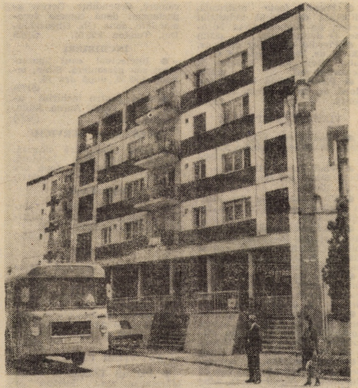
Imagine din centrul orașului Ocna Sibiului