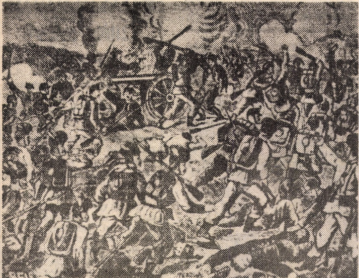
Asalt asupra redutei Grivița (Gravură)