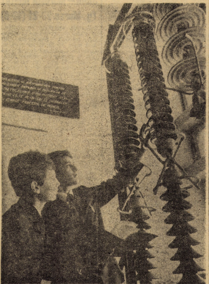
Pe baza unui bogat material instructiv din dotarea laboratoarelor Liceului industrial energetic nr. 1, Sibiu, elevii ultimelor clase își completează cunoștințele teoretice