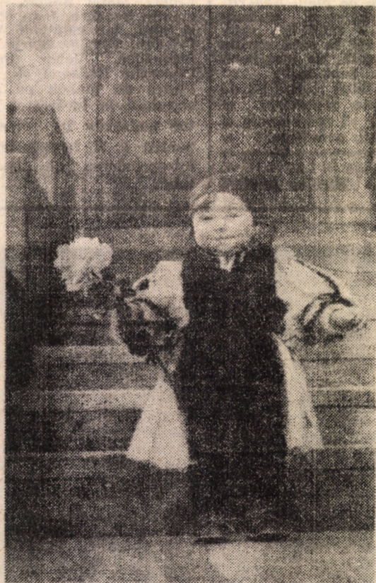
„Doar o floare-n mină am Fiindcă am împlinit un an”

După moartea renumitului lutier, în urma lui au rămas 1120 instrumente, în marea lor majoritate violi. În prezent se mai păstrează doar 600 de violi, din care cu 100 se mai poate cânta.