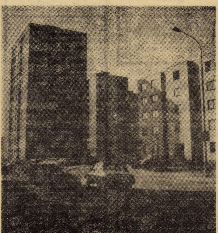
Din peisajul arhitectonic al cartierului sibiian „Vasile Aaron“

În condițiile în care învățămîntul tehnic sibiian este preponderent seral, șansele de valorificare cresc. În acest sens s-a încercat, și în bună parte s-a reușit, ca să se repartizeze teme din profilul și preocupările întreprinderii în care muncește studentul. Tema de diplomă poate deveni astfel chiar sarcină de serviciu pentru student. Precum se vede, în atari condiții, întreprinderile pot juca un rol mai activ în valorificarea proiectelor și lucrărilor de diplomă. De altfel, principial vorbind, procesul de valorificare presupune concursul larg și operativ al întreprinderilor sibiene beneficiare. În acest sens, specialiștii sibiieni sînt invitați să răsfoiască colecția de fișe a institutului, adevărat tezaur de idei, dar și de soluții moderne, eficiente.