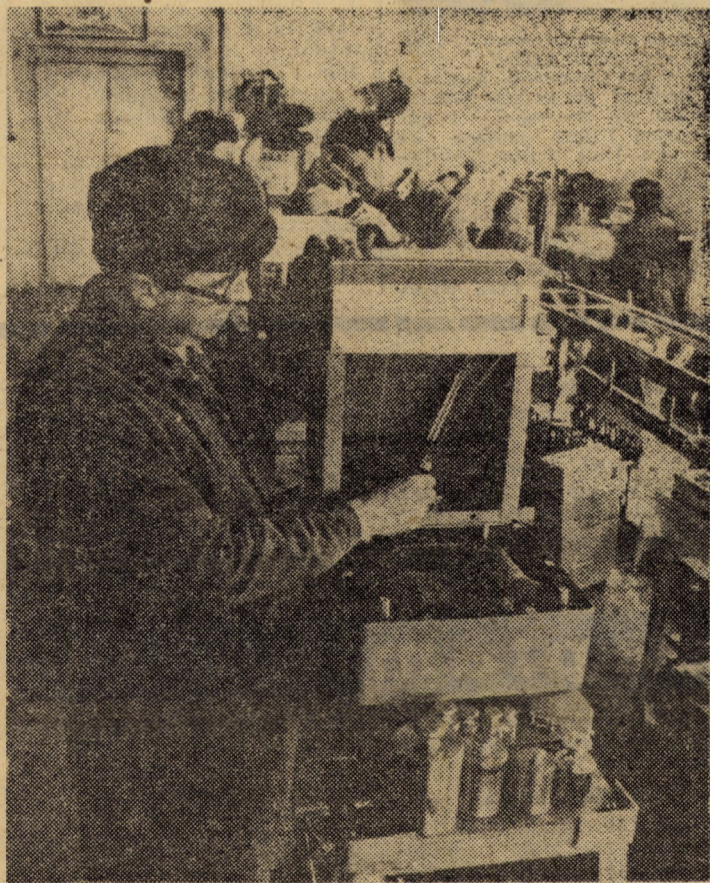
Întreprinderea „Balanța” Sibiu, Vă redăm — în imaginea de față — linia de montaj a balanțelor semiautomate de 10 kg, cu greutate adiționale, unul din noile produse ale unității

Clubul presei sibiene și Asociația scriitorilor din Sibiu organizează astăzi, ora 18, în sala de festivități a Consiliului județean al sindicatelor (Bulevardul Victoriei nr. 10) o seară literară în cadrul căreia va avea loc lansarea — în prezența autorului — a volumului de poezie „Apă de băut” de scriitorul iugoslav Adam Puslojic. Participă, de asemenea, scriitorii iugoslavi Srba Ignjatovic și Ioan Flora precum și Petre Stoica, Cornel Ungureanu, Mircea Ivănescu, Mircea Tomuș și Ion Mircea. În cadrul serii vor mai evolua orchestra de cameră a Școlii generale nr. 14 cu program special de muzică și grupul de recitatori al Liceului „Gheorghe Lazăr” din Sibiu.