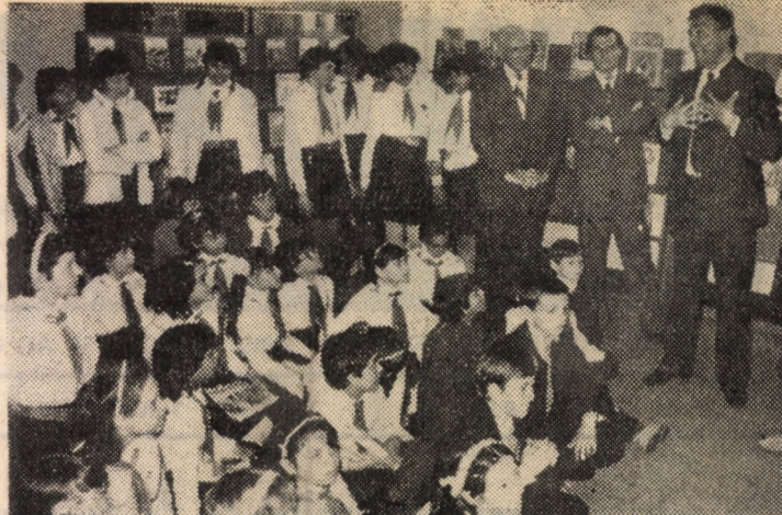
Un moment așteptat de micii cititori: la deschiderea Salonului județean al cărții pentru copii, pionierii s-au întâlnit cu poetul Petre Ghelmez