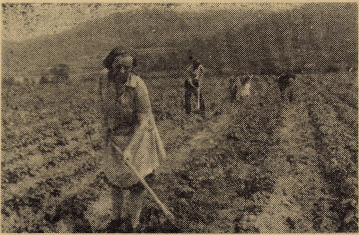
Momente „de virf” la lucrările de întreținere. Secvență de muncă pe ogoarele C.A.P. Șelimbăr

Precipitațiile din ultima perioadă au stimulat puternic procesul vegetativ. Plantele cresc văzând cu ochii și, odată cu ele, se dezvoltă buruienile care, mai bine adaptate la condițiile de mediu, au tendința să înăbușe culturile. Oamenii muncii de pe ogoare, conștienți că soarta recoltelor depinde în mare măsură de ei, de priceperea lor de a ameliora condițiile oferite de natură și de a le apropia de cerințele plantelor față de climă și sol, acționează cu multă răspundere. Membrii cooperatori din unitățile componente ale C.U.A.S.C. Axente Sever au încheiat prașila a II-a mecanică și manuală