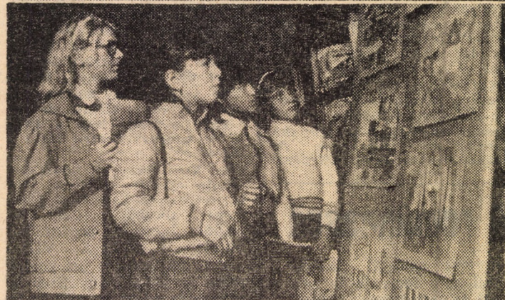
Imagini de la vernisajul expoziției „Povești cu ochi de floare” găzduită de biblioteca „Astra”