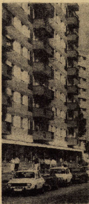
Arhitectură nouă în cartierul sibian Hipodrom III

COLEX, pe care noi l-am utilizat pentru prima dată în țară, este un cofraj din grinzi de lemn, cu placaj tegofilm de 15 mm, realizat tot în module de diferite mărimi. Se pretează foarte bine la turnarea casei scării și la lifturi”.