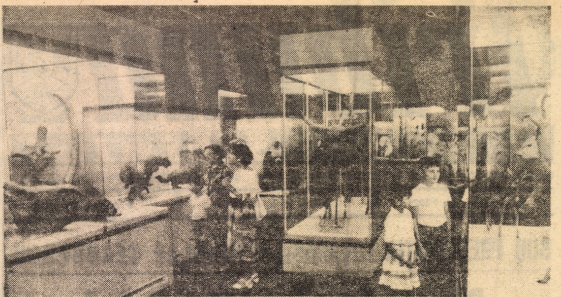
Din interioarele Expoziției de istorie naturală a Complexului muzeal Sibiu — unul din locurile de atracție pentru vizitatori, mai ales pentru cei mici