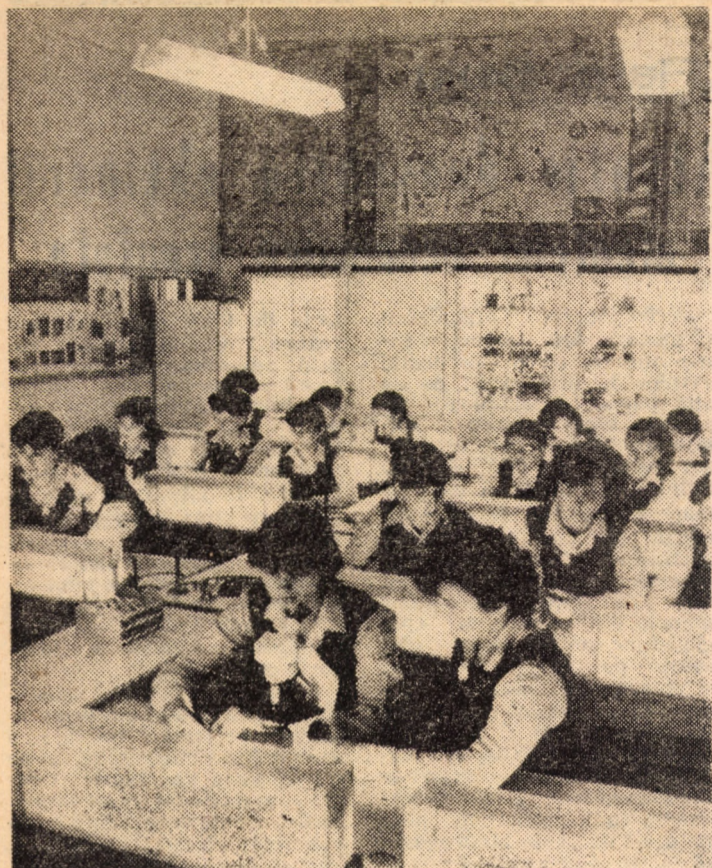
Cu ajutorul unui bogat material didactic ilustrativ, a microscopului și a proiecțiilor de materiale documentare, de care dispune laboratorul de biologie al Liceului pedagogic din Sibiu, elevii pot pătrunde tot mai mult în tainele acestei discipline.