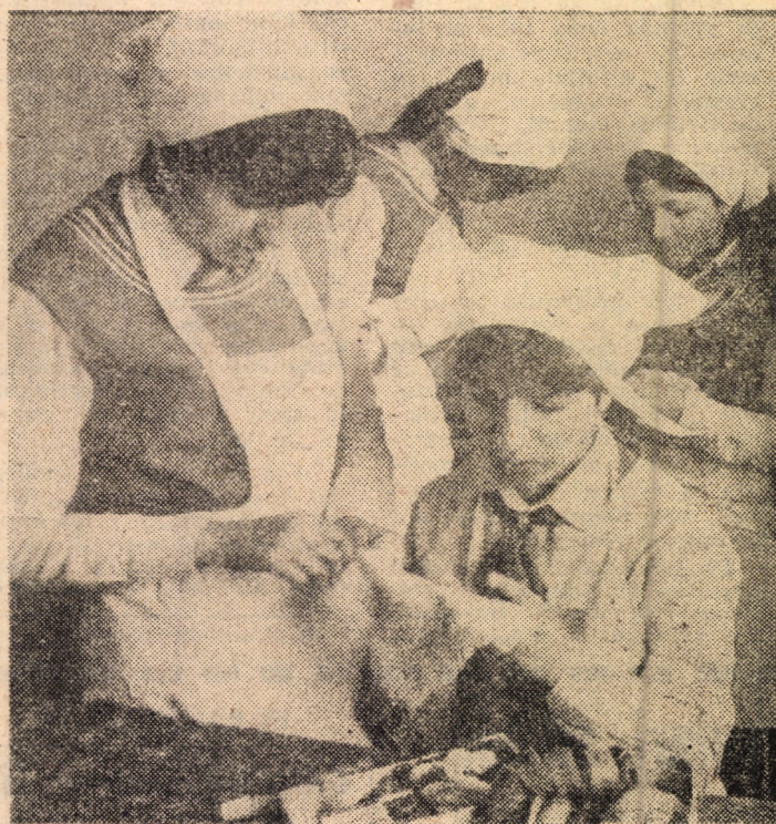
În orele de îndeletniciri practice din școlile generale, ciclul II, viitoarele gospodine se inițiază în executarea unor lucrări de croitorie, cusut, croșetat și tricatat, după cum o ilustrează și instantaneul surprins în clasa a 7-a B de la Școala generală nr. 20 din Sibiu