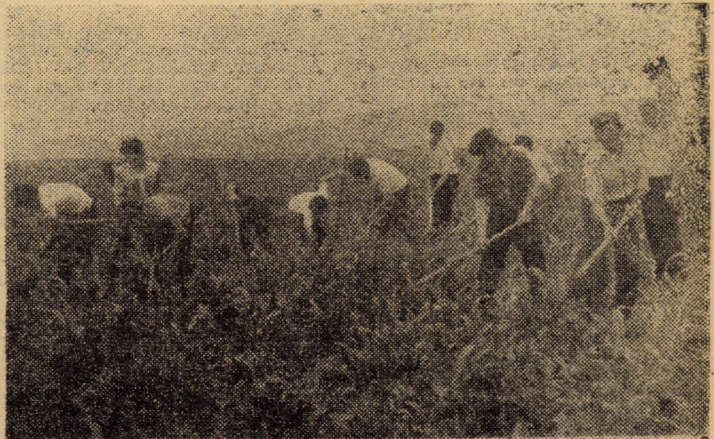
Numeri prin participarea tuturor locuitorilor satelor, inclusiv navetiștii, lucrările de întreținere la culturile prășitoare pot fi încheiate în perioadele optime