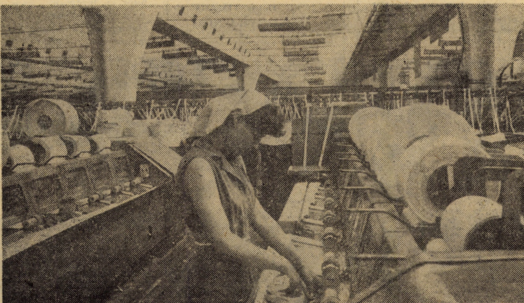
În moderna hală a secției preparăția filaturii de la „Firul roșu” Tâlmăciu se asigură azi cantitatea de fire necesare la un nivel calitativ superior

În program: Concertul pentru orchestră de coarde de Cătălin Ursu; Concert pentru vioară și orchestră de P. E. Ciaikovski și poemul simfonic Don Quijote de R. Strauss.