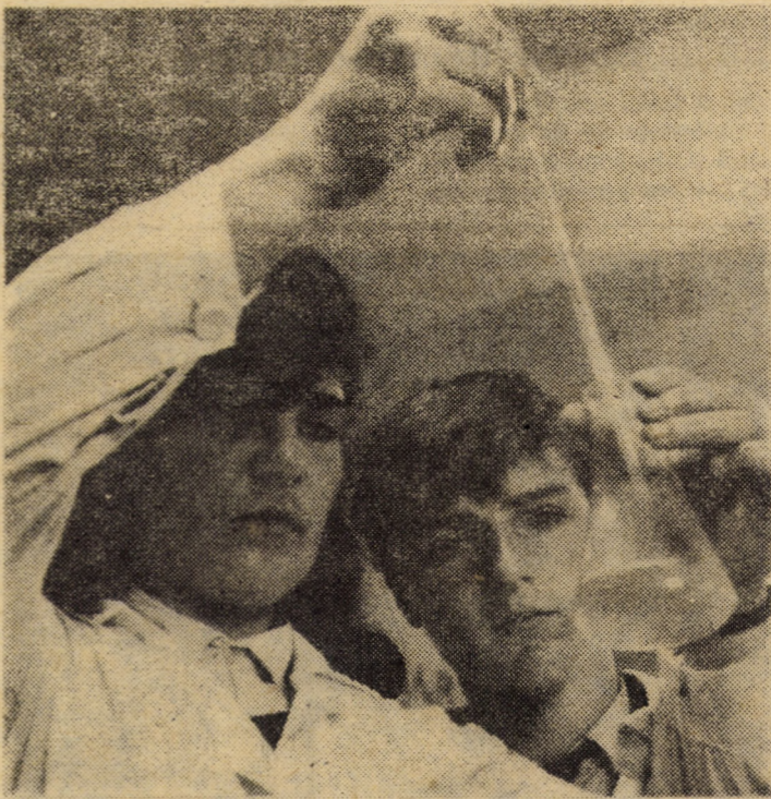
Dornici de a pătrunde în tainele chimiei, de a-și însuși cît mai temeinic cunoștințele primite în orele de curs, elevii de la Liceul industrial „Carbosin” Copșa Mică petrec o bună parte din timpul afectat acestei discipline în laboratoarele bine utilate ale acestei unități școlare