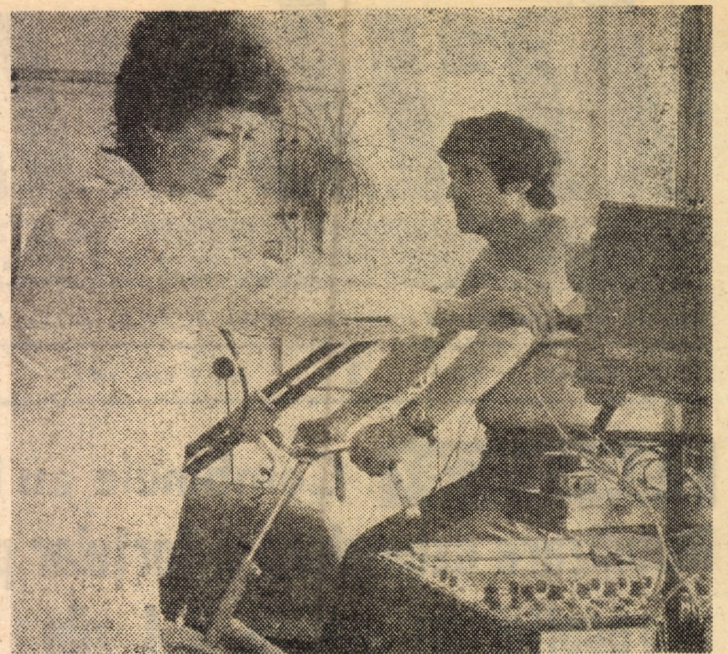
Prin intermediul fotografiei de față, vă înfățișăm un aspect din activitatea cabinetului de recuperare a bolnavilor, aparținînd de secția cardiologie a Spitalului județean Sibiu, cabinet care în ultimul timp a beneficiat de o dotare cu o aparatură modernă de investigație