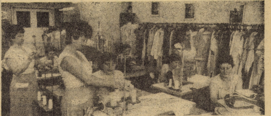
Imagine din atelierul de creație mătase al întreprinderii „Drapelul roșu Sibiu — locul unde sînt concepute și executate noile produse, propuse pentru contractări.