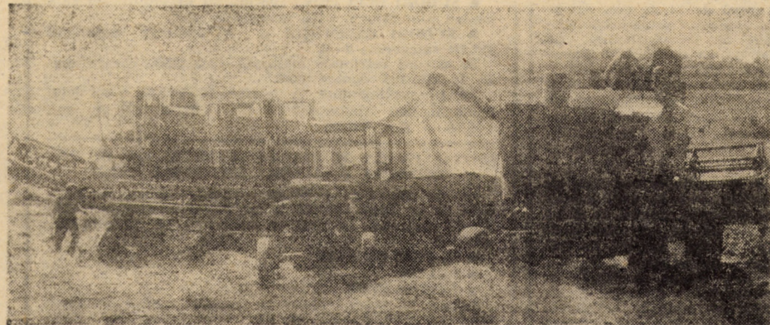
Momente fierbinți, la strinsul și transportul recoltei. Secvență la seceriș din C.U.A.S.C. Loamnes

firmăm aceasta avem în vedere că în momentul când sînt date la tipar aceste rânduri producția secundară (paiele) este balotată și plugurile pregătesc terenul în vederea însămînțării culturii duble. De altfel, într-un teren învecinat procedindu-se tot atât de operativ la eliberarea terenului cultura de seară masă verde, a răsărit uniform și deasă ca peria.