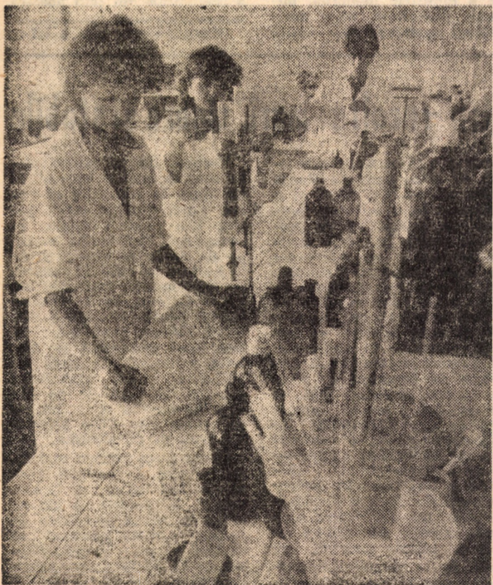
În laboratorul de analize fizico-chimice al Oficiului de gospodărire a apelor Sibiu se veghează în permanență asupra calității apelor, distribuite localităților din județul nostru

Ion Viță „Probleme de fizică cu situații impuse pentru bacalaureat și admitere în învățămîntul superior“, Seria „Culegeri de probleme de matematică și fizică“, Editura Tehnică, 224 pagini, lei 13