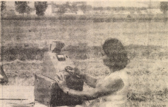
Pentru declanșarea secerișului imediat ce starea lanurilor o permite, la punctele de lucru se urmărește permanent procentul de umiditate a boabelor