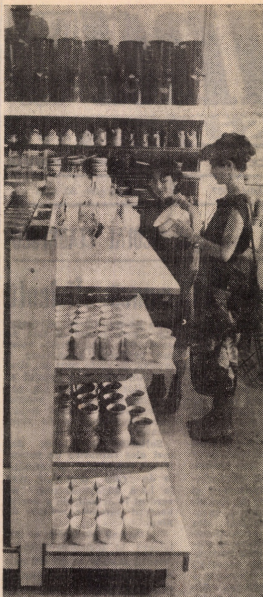
Prin grija edililor municipiului nostru, în noile cartiere de locuințe ale Sibiuului, la parterul multor blocuri au fost deschise o serie de unități comerciale, menite să satisfacă cerințele cetățenilor. În fotografie: magazinul cu articole de menaj din cartierul Valea Aurie

Exprimându-și convingerea că și în viitor receptivitatea locuitorilor municipiului Mediaș față de activitățile organizate în cadrul Universității cultural-științifice va înregistra aceleași valori ridicate, participanții la adunarea largită a consiliului de conducere au relevat hotărârea lor fermă de a face și mai mult, de a acționa și mai convins pentru ca efectul benefic al acestor cursuri să se regăsească pozitiv în activitatea de ansamblu a medienilor. Nicolae IVAN