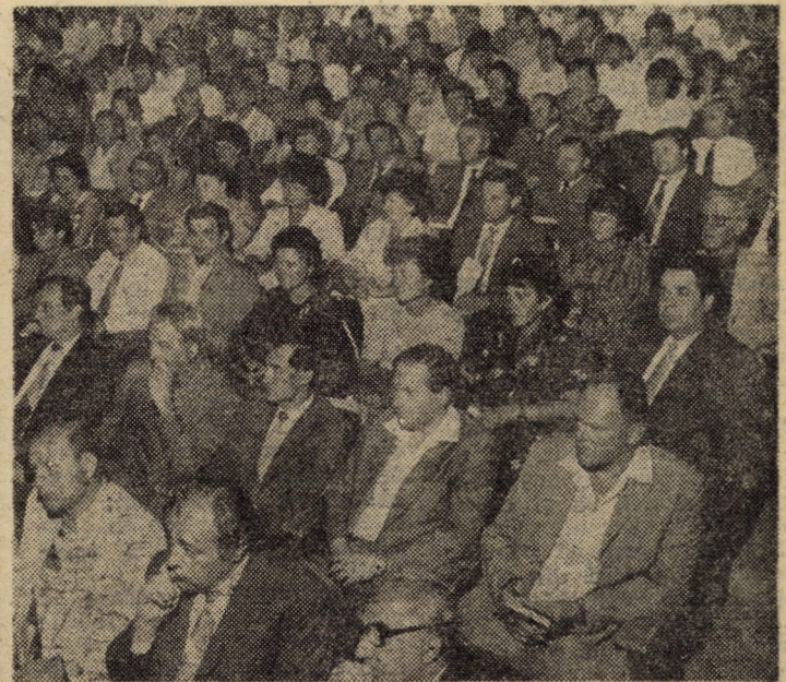
Aspect din sală, în timpul Conferinței județene a educației politice și culturii socialiste.