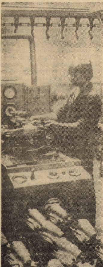
La unul din standurile de probă pentru mecanismele de servo-direcții de la I.P.A. Sibiu.

(Continuare în pag. a III-a) I. FLESCHEAN