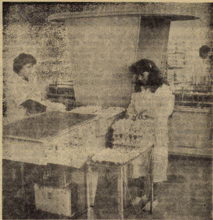
Asociația economică intercooperativă „Avicola” Sibiu. De la această unitate sint livrate consumatorilor din județ peste 100 000 ouă zilnic

Comitetul Politic Executiv a soluționat, de asemenea, probleme curente ale activității de partid și de stat.