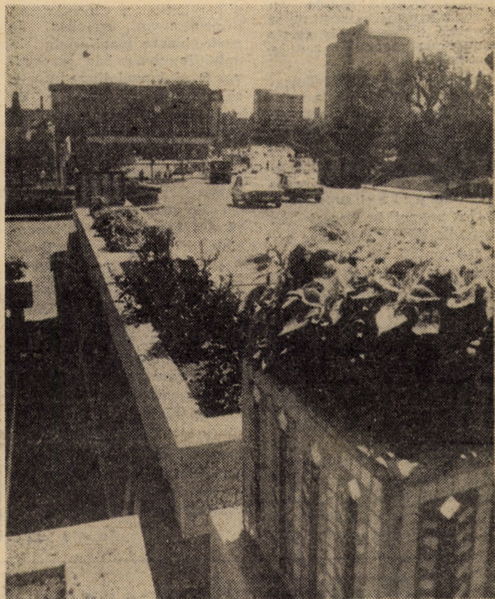
Prin grija edililor municipiului nostru, centrul Sibiului are azi înfățișarea unui oraș atrăgător și primitiv, pe traseele căruia se perindă un mare număr de vizitatori

A fost subliniată contribuția pe care parlamentele și parlamentarii pot și trebuie să o aducă la imprimarea unui curs nou în viața internațională, spre destindere și dezarmare, la instaurarea în Europa, Africa și în întreaga lume a unui climat de pace, securitate, încredere și cooperare, la înfăptuirea aspirațiilor de libertate, independență și progres ale tuturor popoarelor.