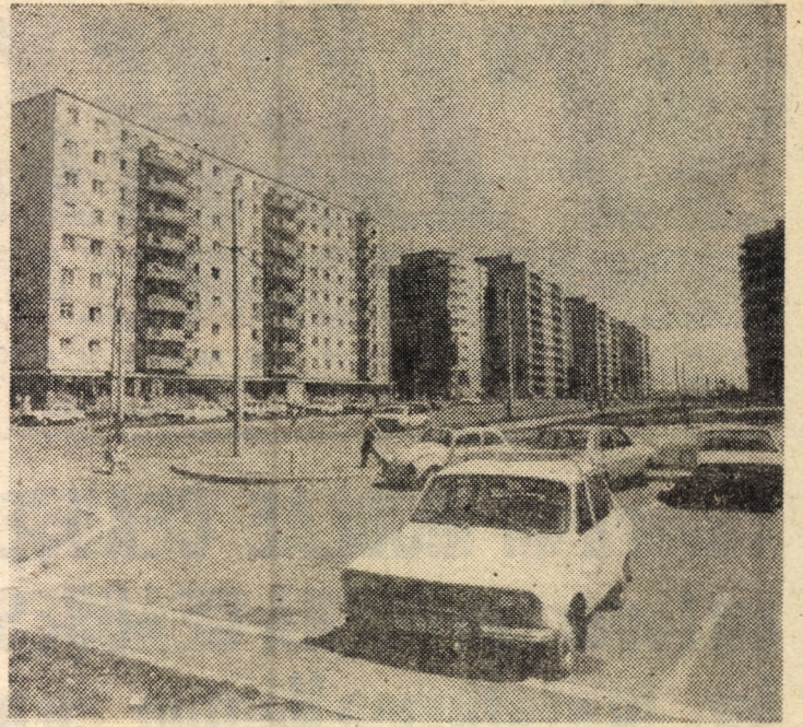
Din frumosul peisaj arhitectonic al cartierului sibian Hipodrom III.