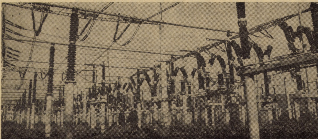
Eforturile multiple pentru asigurarea energiei includ și activitatea responsabilă a oamenilor muncii de la Stația de transformare Sibiu-Sud

Mai notăm și rezultatele obținute, urmare a eforturilor făcute de colectivele de oameni ai muncii de la „Independența” Sibiu și „Vitrometan” Mediaș, pe linia recuperării din restanțele anterioare la sortimentele oțel brut și aliat și, respectiv sticlărie de menaj. (C.B.)