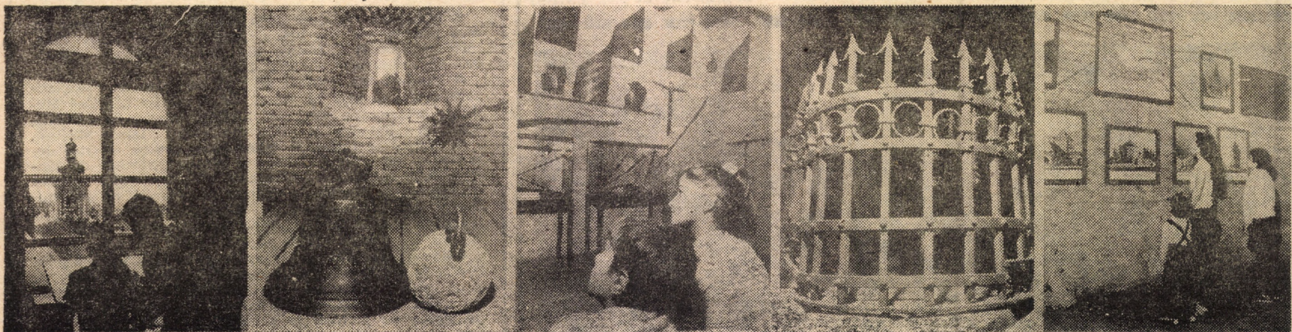
Expoziția muzeală din Turnul sfatului, una din unitățile Complexului muzeal Sibiu, atrage zilnic, prin exponatele sale privind istoria Sibiuului vechi, un însemnat număr de vizitatori.