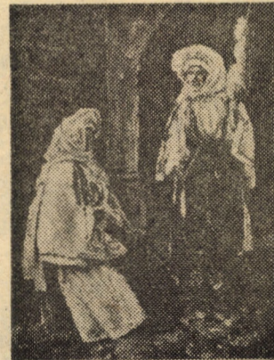
Lucrări expuse în cadrul Salonului județean al artiștilor plastici amatori sibieni