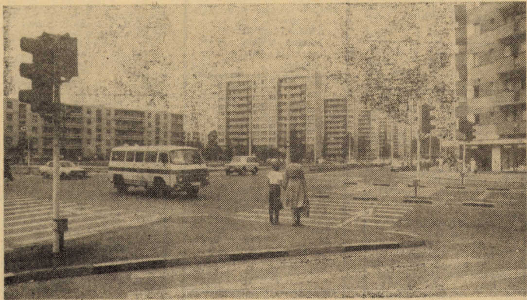
Așa arată azi intersecția străzilor Mihai Viteazul și Kolarov din cartierul Hipodrom, Sibiu, după ample lucrări de modernizare, cu circulație dirijată pentru pietoni și autovehicule

A fost exprimată convingerea că toți oamenii muncii, în frunte cu comunistii, cu deputații, vor acționa cu abnegație și devotație, cu maximă responsabilitate pentru realizarea exemplară a planului, întîmpinînd alegerile de deputați în consiliile populare municipale, orașenești și comunale precum și Conferința Națională a partidului cu noi și remarcabile fapte de muncă.